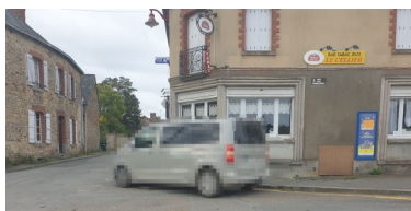
STATIONNEMENT GÊNANT ET DANGEREUX

De nombreuses incivilités sont à déplorer dans la commune ces dernières semaines. Il est demandé à chacun de veiller à respecter la propreté des lieux, les bâtiments, règles de circulation...afin que notre commune reste conviviale et agréable.