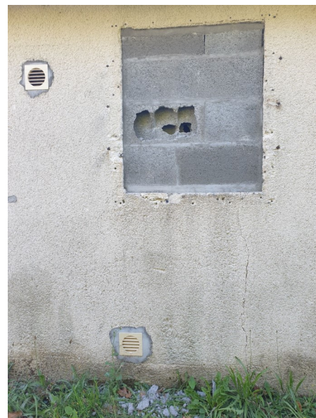
DÉGRADATIONS AUX VESTAIRES DU TERRAIN DE FOOT