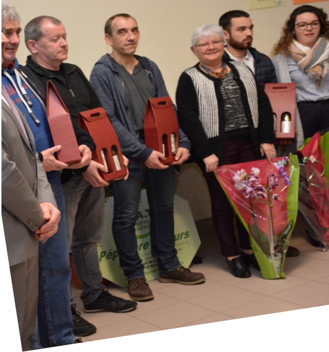
Félicitations à tous les médaillés de 2019 !