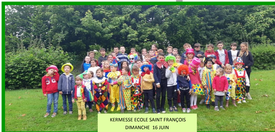
KERMESSE ECOLE SAINT FRANÇOIS DIMANCHE 16 JUI