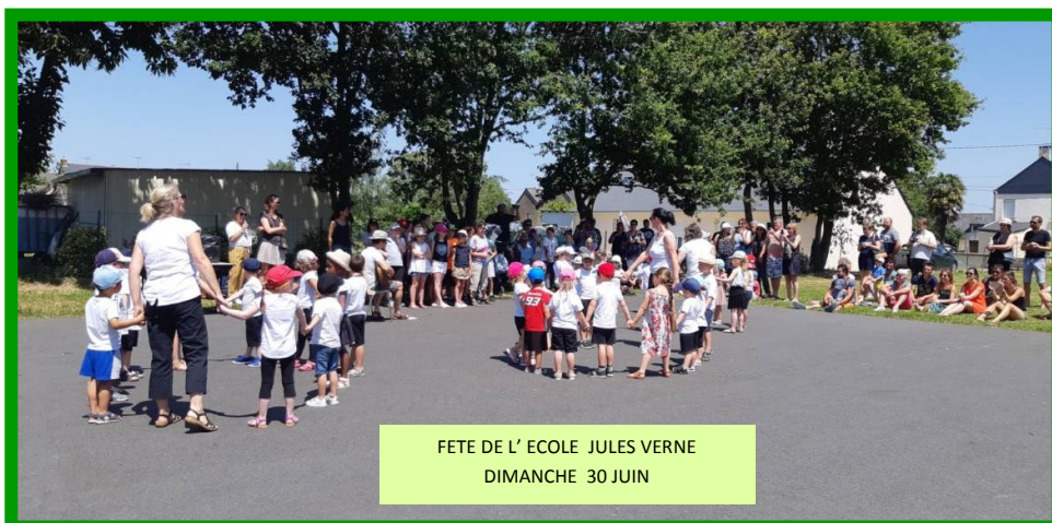
FETE DE L' ECOLE JULES VERNE DIMANCHE 30 JUI

A l'approche des vacances les écoles ont réalisé leur kermesse respective pour le plus grand plaisir des Erceéens. Félicitations à tous les enfants, aux équipes enseignantes et aux parents qui se sont mobilisés.