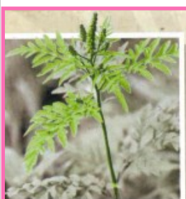
L'AMBROISIE À FEUILLES D'ARMOISE

L'Agence régionale de la santé Bretagne et la Fédération régionale de défense contre les organismes nuisibles (FREDON) alertent sur la présence de plantes exotiques qui commencent à envahir les jardins, les champs, les bords de route de Bretagne, lesquelles peuvent être néfastes pour la santé : pollen allergisant, sève pouvant provoquer des brûlures, baies toxiques... C'est pourquoi des réseaux d'observateurs locaux se mettent en place sur toute la région, afin de limiter leur propagation. Sur votre territoire c'est à la communauté de commune qu'il faut se référer localement, laquelle sert de relais avec la FREDON pour organiser l'arrachage de ces plantes. Des dépliants vous permettant de reconnaître facilement ces plantes sont à votre disposition en mairie ou à la communauté de communes.